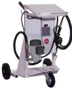
elektrisch / Zapfschlauch

Mehrpreis für Kabeltrommel Artikel Nr.: 8804