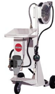
elektrisch / Schlauchaufroller