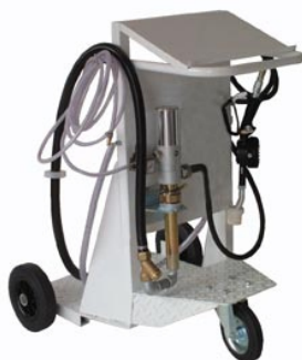
pneumatisch / Zapfschlauch