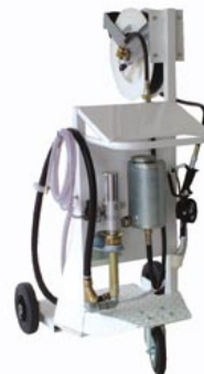
pneumatisch / Schlauchaufroller

Bei der Verwendung von pneumatischen Pumpen empfehlen wir den Einsatz einer Wartungseinheit, Artikel-Nr.:7898